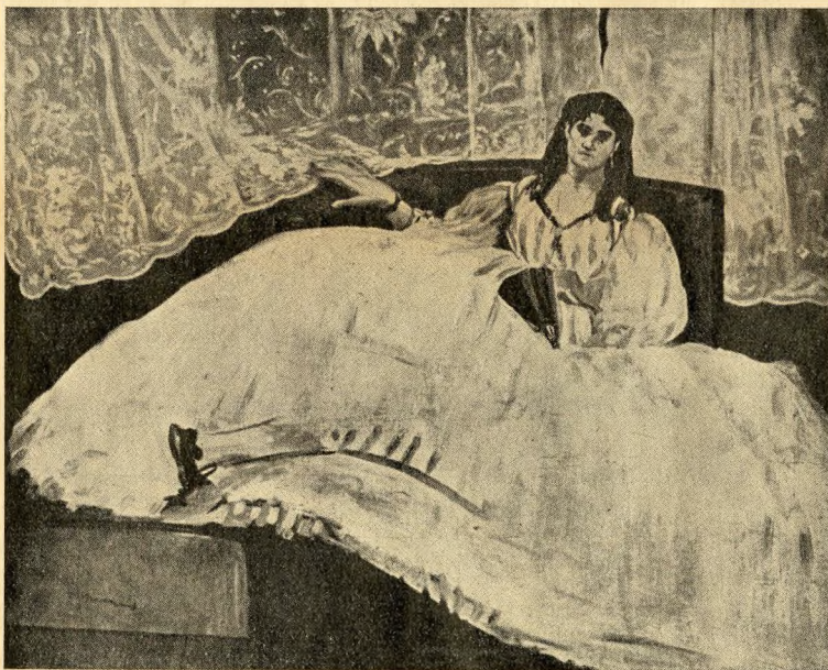
Delacroix: Arab és lova — Manet: Hölyg legyezővel

presszionizmus chef-d'oeuvrejei közé tartozik. Monet és Pissarro két-két tájképe a barbizoniakkal összehasonlítva érzékeltetik az impresszionizmus formafelbontó, napfényes korszakát. Toulouse-Lautrec kávéházban tanyázó hölgyei a párisi fin de siècle figurái. Az impresszionizmus után új stílus következik, a trópusokra menekülő Gauguin tahitii tájainak és a kisvárosba húzódó Cézanne csendéleteinek a formát, színt, vonalat ha-