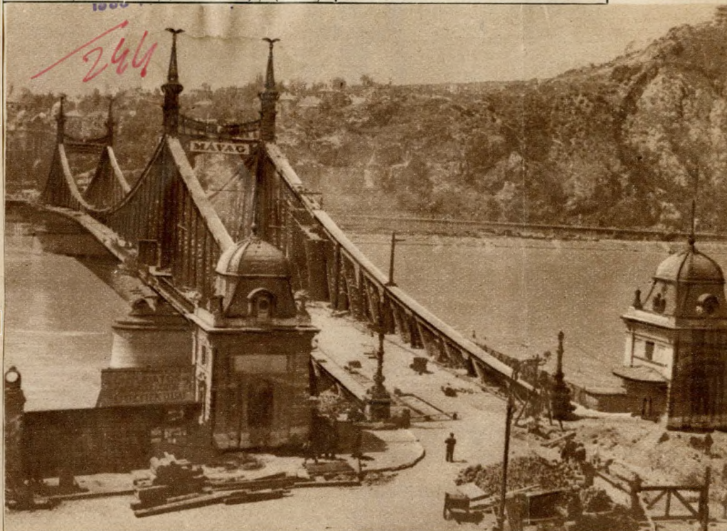
A MÁVAG dolgozói építették újjá a felszabadulás után a Szabadság-hídat