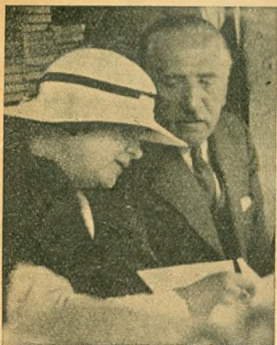
Gulácsy Irén és Herczeg Ferenc az Új Idők sátrában

Ötödik éve annak, hogy a Könyvnap eszméje megszületett. Az ötödik Könyvnapot tartottuk az idén és mi úgy érezzük, hogy a könyvnek ez a korányári vásárosünnep volt eddig valamennyi között a legközvetlenebb, legbensőségesebb. Nem volt ünnepélyes, nem volt feszélyezett. Az volt, aminek lennie kell. Az olvasó ismerkedése az íróval, akivel a művein keresztül már kapcsolatot érzett, de akit testi formájában is szeretett volna megismerni. (Mert hisz nem véletlen adottság a külső. A Teremtő, nagyon kevés kivétellel, úgy alkotta meg az embert, hogy a külsejében kifejezésre jutnak a belső adottságai is.) Az olvasó találkozott ezen a napon az íróval és egy kézfogással, néhány szóval, néhány kedves, megértő tekintettel még közelebb jutottak egymás lelkéhez.