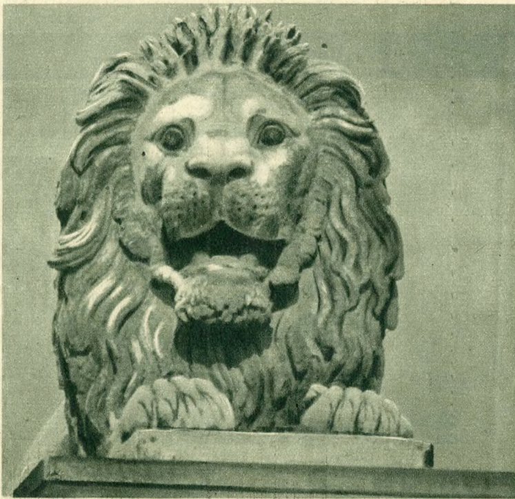
A lánchídi oroszlán