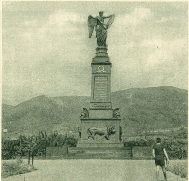
A kulmi emlékmű