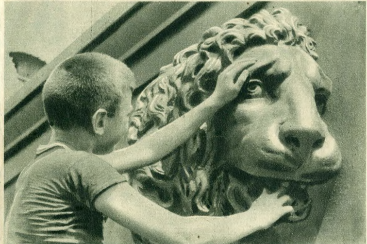
Ennek az oroszlánnak sincs nyelve?