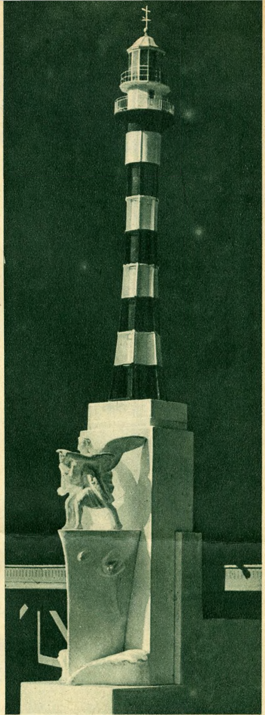
A tengerész-emlékmű modellje.

hogy a támadás géniusza vezeti a tengerészt. A nagyháboruban a monarchia hajóhadát erőssé és naggyá tette az a támadó szellem, amely merész és komoly haditettek véghezvitelében nyilvánult meg. A tengerész-emlékművön egy matróz áll, figyelve a hullámokat és keresi az ellenséget, a támadás géniusza pedig kinyújtott karral mutatja neki az irányt. A matróz és a géniusz egy hajóorrán, a legendáshírű Novara hajó orrán állnak.