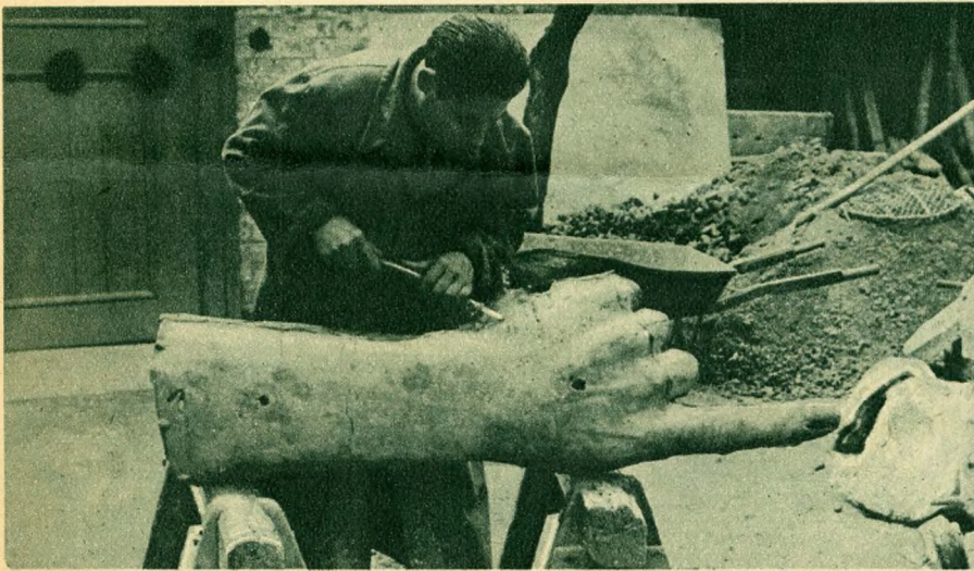
Az iránymutató géniusz jobbkeze. Alsó kép: a géniusz feje.