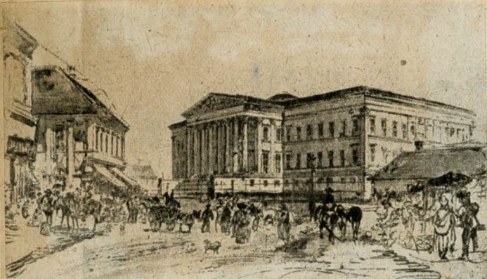
Egykorú rajz Pollack Mihály nagy alkotásáról, a Nemzeti Múzeum épületéről. A rajzon jól látható, a szomszédos kis lakóházak között, a hajdani »Két Pisztoly« csárda