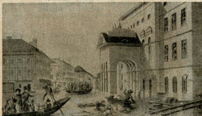
Pollack Mihály elpusztult műve: a régi Német Színház, az 1838-i árvíz idején. Egykorú rajz

1955. január 3-án lesz száz esztendeje, hogy meghalt a magyar neoklasszikus építőművészet nagy mestere, Pollack Mihály . 1773-ban született Bécsben és csak 1806-ban jött Magyarországra Aman bécsi építész tervével, hogy a Várban felépítse a Sándor-palotát, az ostromban elpusztult miniszterelnöki székházat. Akkoriban az uralkodó kor-szellem az ókor klasszikus vi-