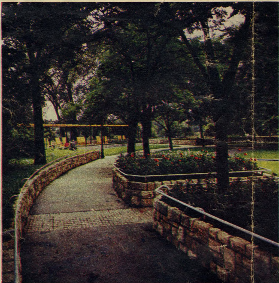
A Városligetben épült meg a vakok és csökkentlátók kertje

M indannyiunk kertje: a park. Pontosabban az, amely a közterületen zöldell és sokszínű virágaival szemet, szívet gyönyörködtet. De a nagyvárosban nemcsak a szépség, a gyönyörködtetés fontos, hanem az egészség ápolása, megőrzése is.