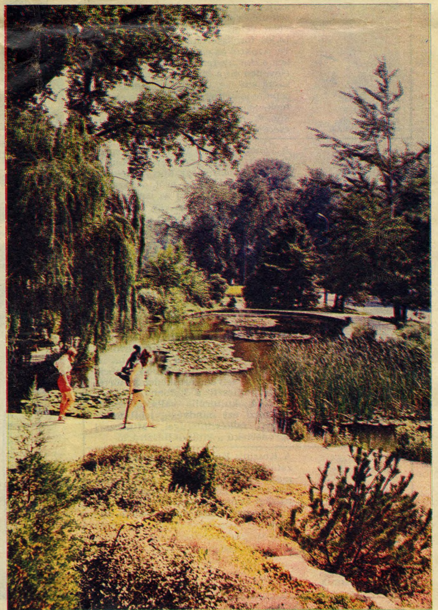
A Margitsziget északi csücskében szemet-szívet gyönyörködtet a japánkert