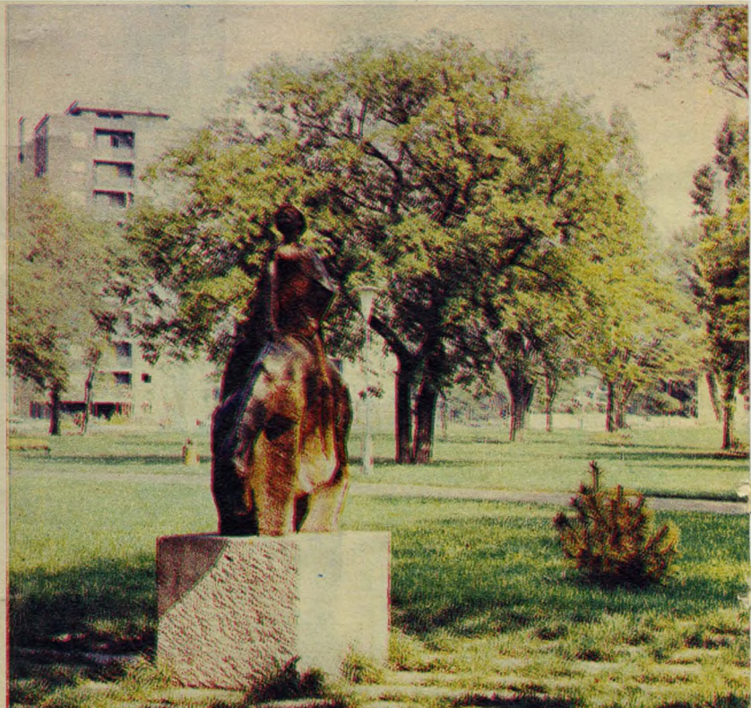
Játékos szobrok, kerámiák is díszítik az úttörők parkját: a Kőbányai Porc

Lelkesedésben tehát nincs hiány, ám a fővárosi kertészetnél a szakemberek arra intik a kerületek vezetőit, társadalmi munkásait, hogy gondosan készítsék elő a leendő parkokat, mert ahol „megfelekednének”, mondjuk, a vízvezetékéről, annak a területnek a fenntartását,