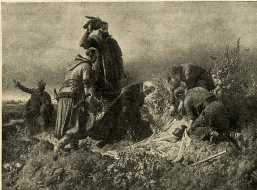
Székely Bertalan: II. Lajos tetemének megtalálása

II. Lajos hullájának feltalálása. Olajfestmény Székely Bertalantól. E mű kétségtelen talentomos művészt áruel s még több reményre jogosít felőle. Nagy szorgalom s lelkiismeretes tanulmányozás párosul e műven a talentommal s az ily tehetséges igyekezet öröme ger-