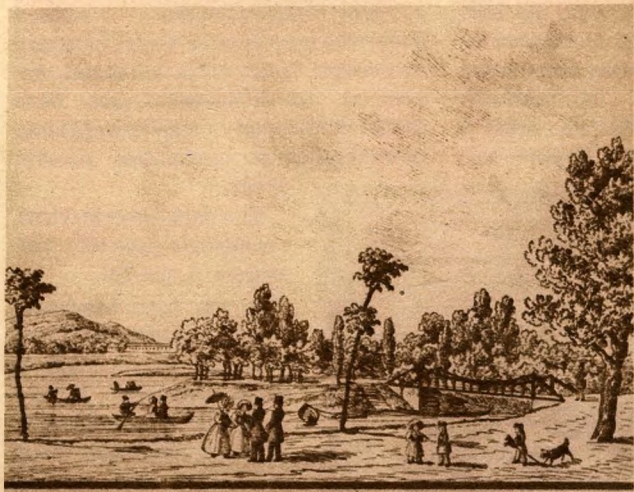
Pestvárosa ligetében a lánchíd.

akkor még csak egy volt, az 1826-ban épített dróthíd, előkelőbben; lánchíd. Mivel pedig csak egy hid volt, annál nagyobb szerep jutott a csónakázásnak. Még 1844-ben is azt olvassuk, hogy