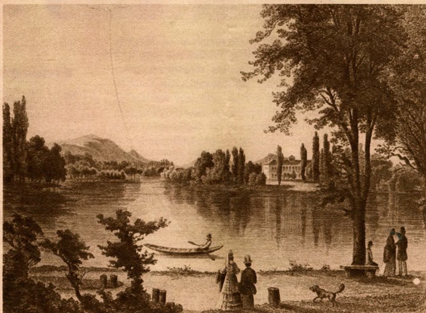
A Városliget az 1850-es évek végén.

A költők is pártját fogták a ligenek. Arany János , aki pedig ugyan-csak rajongója volt a Margitszigetnek , nem sajnált egy ti-