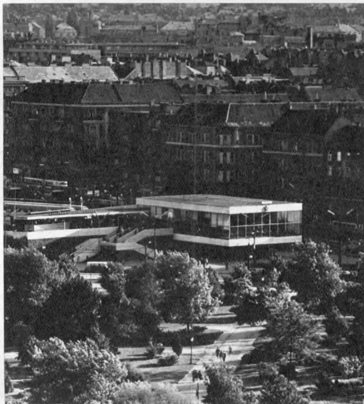
A pályaudvar főépülete az átépítés előtt