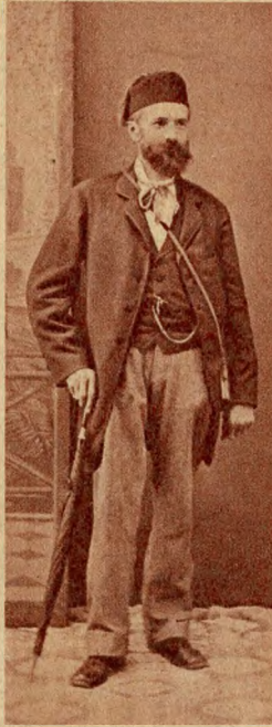
Hopp Ferenc Tuniszban.

Miért, miért nem, egy jól megtermett nőt ábrázoló kép há- tlapján olvasom e ce- ruzával írt sorokat: »Aden 21 Sept 1882, Indischer Ocean 22 Sept. Melbourne 24 October 1882. Sydney 27 Octob. 1882. Bris- bane 5. Novemb. 1882. Baroda 1 February