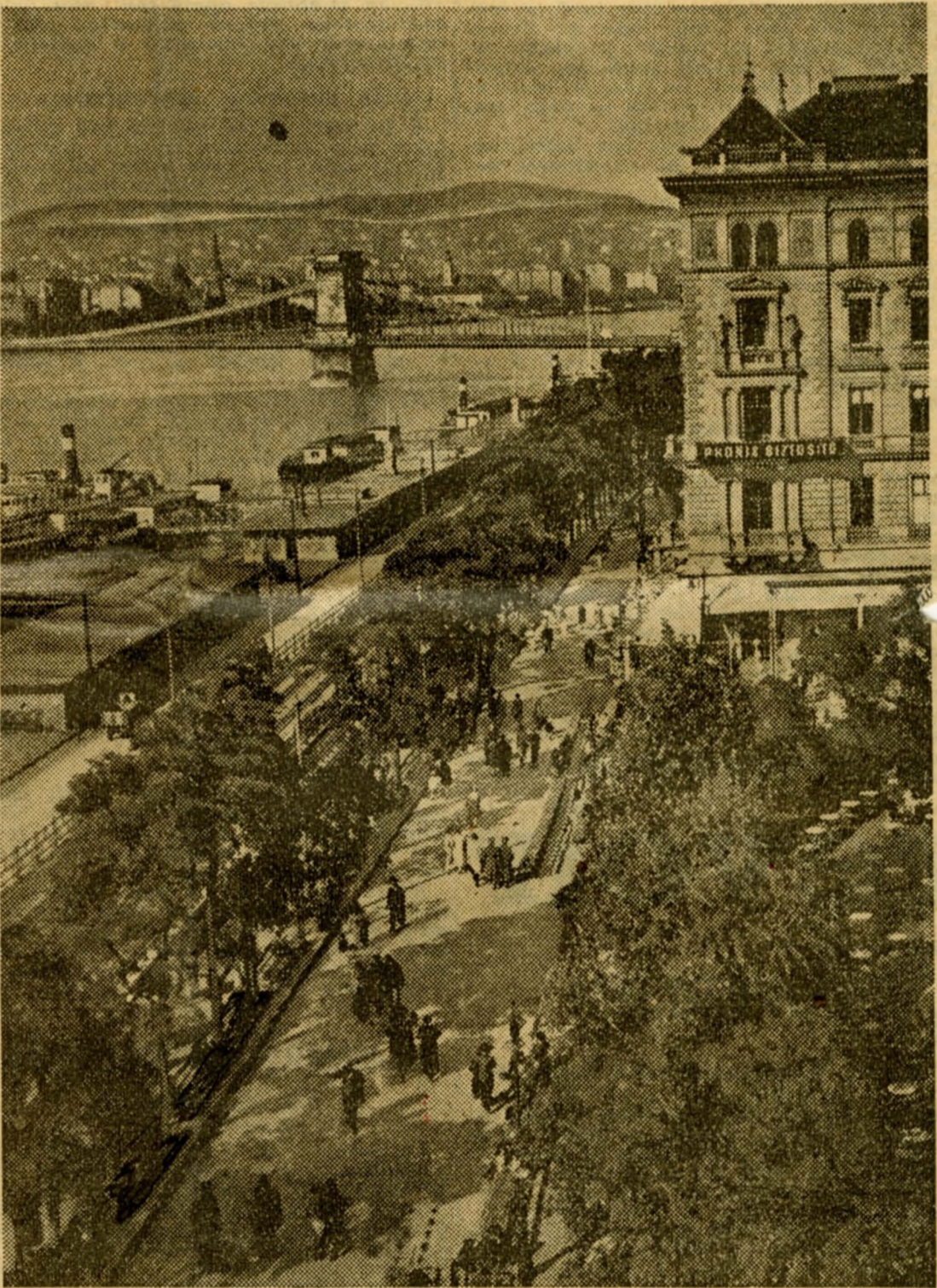
Le « Corso », au bord du Danube, où se retrouvent les élégantes et les flâneurs chaque après-midi et chaque soir.

— Madame, vous avez tort, lui dit-il, car que va-t-il se passer ? Vous allez sûrement vous jeter à l'eau. Moi aussi et je vous sauverai. Vous vous serez donc inutilement mouillée et moi aussi. Vous attraperez une bonne fluxion de poitrine et moi aussi. Et pourquoi tout cela puisque vous ne parviendrez pas à mettre fin à vos jours ? Est-ce très censé ?