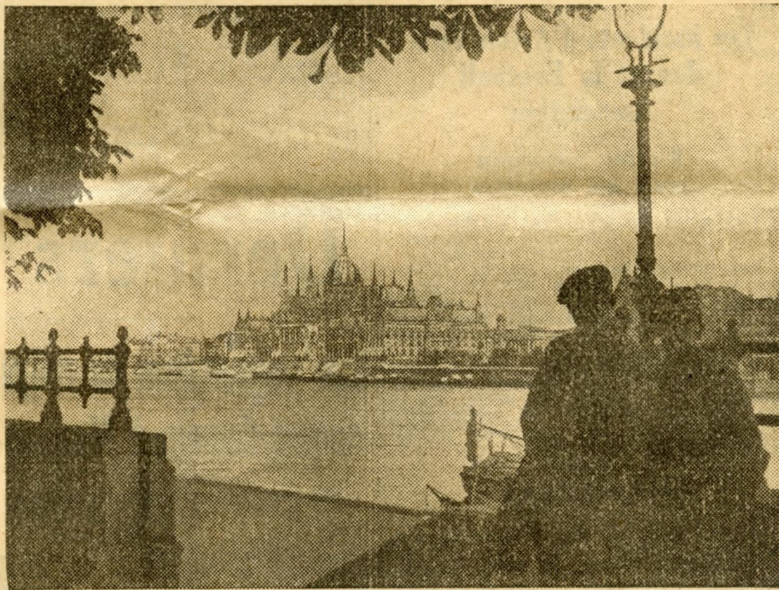
Le Parlement, vu du côté de Buda.

mes, chez Gerbaud une demi-heure plus tard.