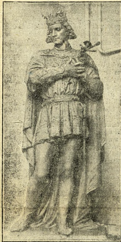
Szent Imre szobra

Izabella királyi hercegnő, a Szent Imre jubileumi év vallásos és nemzeti jelentőségű áthatva, Szent Imre herceg ércszobrát ajándékozta a magyar nemzetnek. Elhatározásáról Horthy Miklós kormányzó levélben értesítette, kifejezve azt az óhaját, hogy „a jubileumi év kegyforrásából a Mindenható legbőségebb áldása áradjon a mi magyar ifjú-