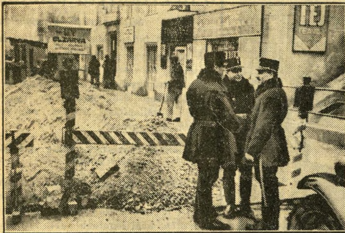
Rendőrkoron zárja el a Lógodi uca veszélyes részét

A m. kir. rendőrcsapat budapesti főkapitánya