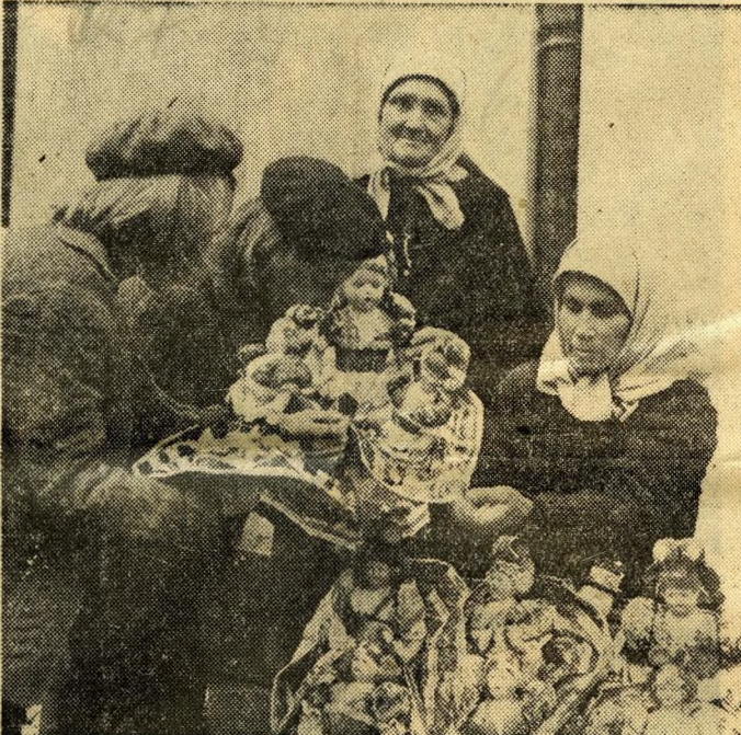
A mezőkövesdi asszonyok babáit csodálja ez a két kislány. De jó is lenne játszani velük. Talán majd karácsonyra ilyen vesz anyuka