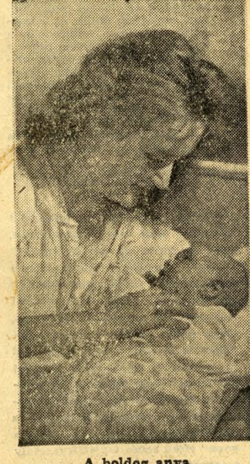
A boldog anya