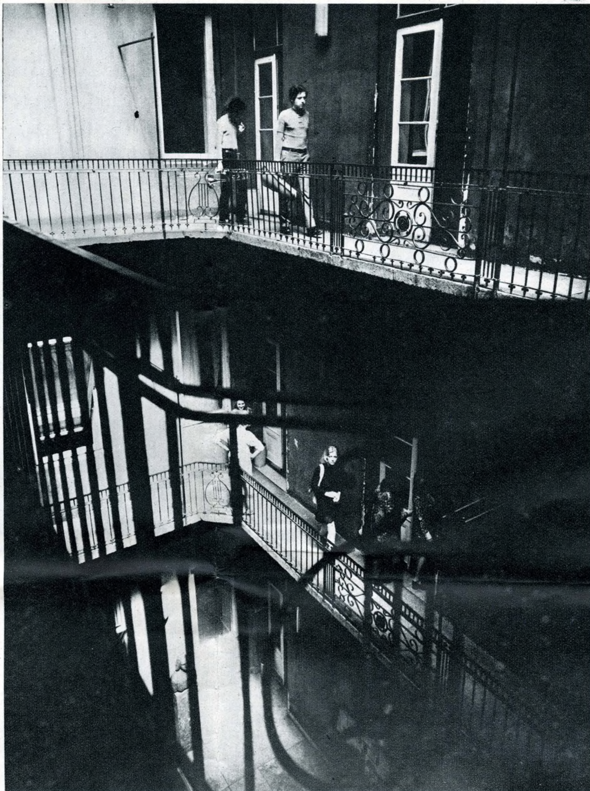
Az épület udvara

Ilyen gondolatokkal korábban már Bartay András is foglalkozott, és egy zenede alapításának tervét a Magyar Tudós Társaság elé tárta. Akkor azonban a tervezetet anyagi okokra hivatkozva elvetették. Bartay nem nyugodott bele az elutasításba: 1837-ben a hangászegyesületi nagytanácsához fordult, amely egy eszterdő múlva fontolóra vette a javaslatot, és végül határozat született zenede létesítéséről.