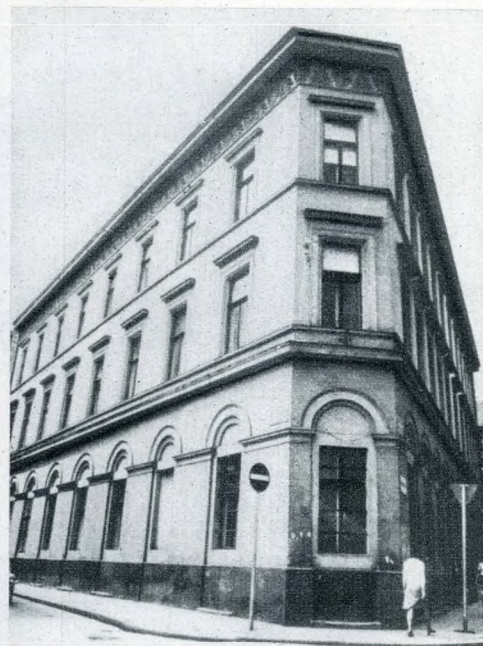
Az épület lépcsőháza és homlokzata