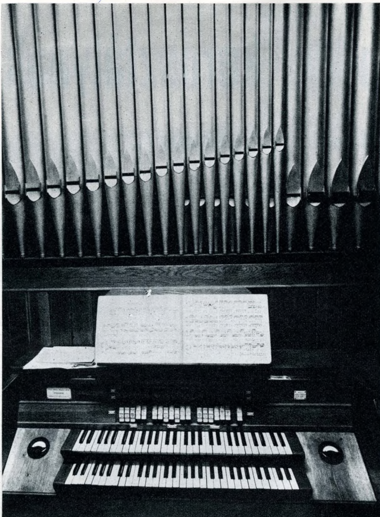
Az iskola orgonája

választása felső- és középfokúra (ez utóbbi feladatát a zenede látta volna el) és szó volt a tervekben munkászeneciskola létesítéséről. A tantervben kötelező szolfézsoktatást javasoltak a három első osztály számára; a zenetanító-képzés tantervébe a hallásképzés, pedagógia és gyakorlati tanítás mellé a gyermekpszichológiát is föl akarták vetetni. A javaslat korszerűségét jelzi az a gondolat, hogy „minden tanszak legfelsőbb osztályaiban a tanításnak ki kell terjednie a jelenkori irodalom megismerésére és tanulására”.