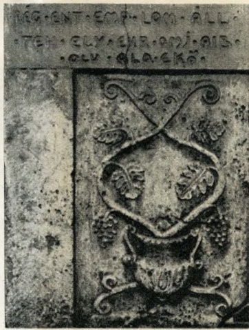
A stilizált edényből kinövő szőlőtőkét ábrázoló kő