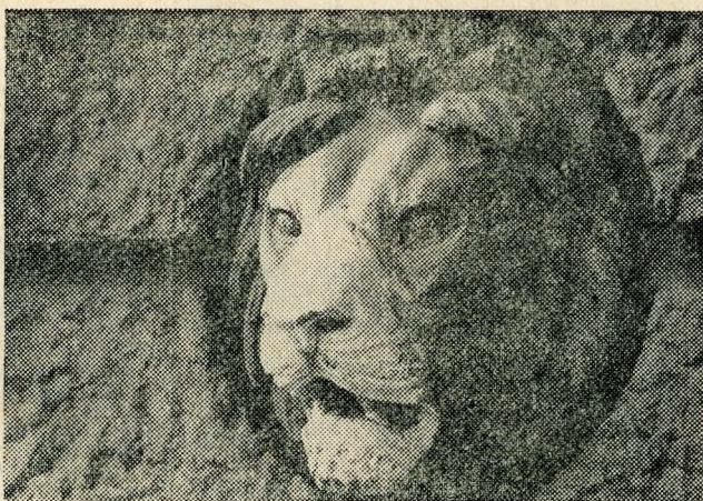
Bernáth András: Oroszlán az egyik földszinti ablak alatt

RÁDAY MIHÁLY Unokáink sem fogják látni című televíziós dokumentum műsora — mely az idei, 22. tévéfesztivál egyéni díjnyertese, s ez reprezentálja minőségi csúcsteljesítményét is — pályázatot hirdetett a Népköztársaság útja házainak dokumentálására. Felnőttek, gyerekek, nyugdíjasok amatőr és hivatásos fényképészek, mindenféle foglalkozásúak jelentkeztek — mintegy százötvenen. A pályázat célja az volt, hogy az épületek jelenlegi állapotát rögzítsék, s felkutassák a még itt-ott fellelhető történeti-művészeti értékeket, így például szobrokat, falikutakat, kovácsoltvas ablakokat, faragott kapukat, kandallókat. Külső és belső felvételeket is készítettek tehát a pályázók (egy házról általában 20—60 darabot