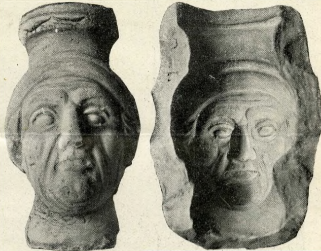
SZOBORDÍSZŰ CSERÉPEDÉNY ÉS MINTÁJA.

cheologiai nevezetességgé fog válni. Hasonló érdekességű berendezésénél és építésénél fogva az a két mészégető kemence is, melyeket a tégláégető közelében találtak, — egyenesen unikum-számba mennek pedig azok a római kori fa-hordók, melyeket a Duna partján egy kútban találtak. Ezek eredetileg szállításra szolgáltak, de később egy kút béléseül használták őket. Beléjük égetett felirat — nyilván vámjelzés — is van rajtuk. Ezeket a hordókat a víz konzerváló ereje mentette meg az enyészettől. Unikumok annyiban, mert egész Európában egyedül csak két németországi múzeumban vannak hasonlóak, de ott is csak egyes dongák s nem egész hordók. Roppant érdekes még egy egész kis arany ékszer-garnitúra, melyet egy bécsi-úti ház építéskor egy szárkofágban találtak, — közte egy arany medallionba foglalt kis kerek üveglap, rajta feliratul egy anekreoni modorú görög szerelmes vers.