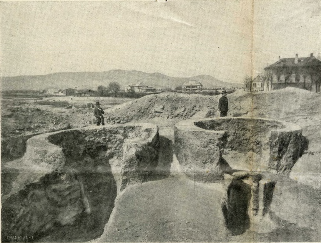
RÓMAI MÉSZÉGETŐ KEMENCZE.