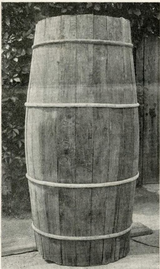
RÓMAI HORDÓ FENYŐFÁBÓL. (Az abroncsokat most csinálták rá.)