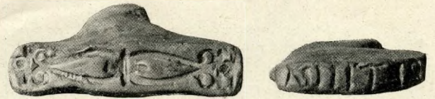
CSERÉPEDÉNYEKHEZ VALÓ STAMBIGLIÁK.

kész edényeket találtak itt, sőt azokat csak kisebb számmal, csupa törött darabokat, hanem az edények égetéséhez való mintákat, milyenekkel a római korra jellemző domborműves díszítésű u. n. terra sigillata edényeket készítették, — sőt az ilyen minták készítésére való stambigliákat is. Így most már megvan itt a római fazekas mesterség minden fázisa szemléltető módon: a kemence a magasajátóságos, a római technikára jellemző alulfűtéses szerkezetével, a stambiglia, a melylyel az edény negatív mintájába a díszítmények egyes elemeit benyomkodták, a homorú negatív minták s a belőlük kiöntött edények a maguk domborműves díszével. Ebből most már teljesen nyilvánvaló, hogy Aquincumban egykor virágzó és önálló fazekas ipar volt, mert az edénymintákról is kétséget kizárólag megállapítható, hogy ugyancsak itt készültek, sőt az egyik gyár tulajdonosának neve: Pacatus is megtudható néhány minta fenekébe benyomva. Az egész leletsorozatnak kulturtörténeti fontosságát rendkívüli módon növeli az, hogy egyetlen provinciális, vagyis Olaszországon kívüli római telepen sem találtak ilyen teljes és részletes sorozatát az agyagipari emlékeknek s az aquincumi edénygyár hovahamarabb ar-