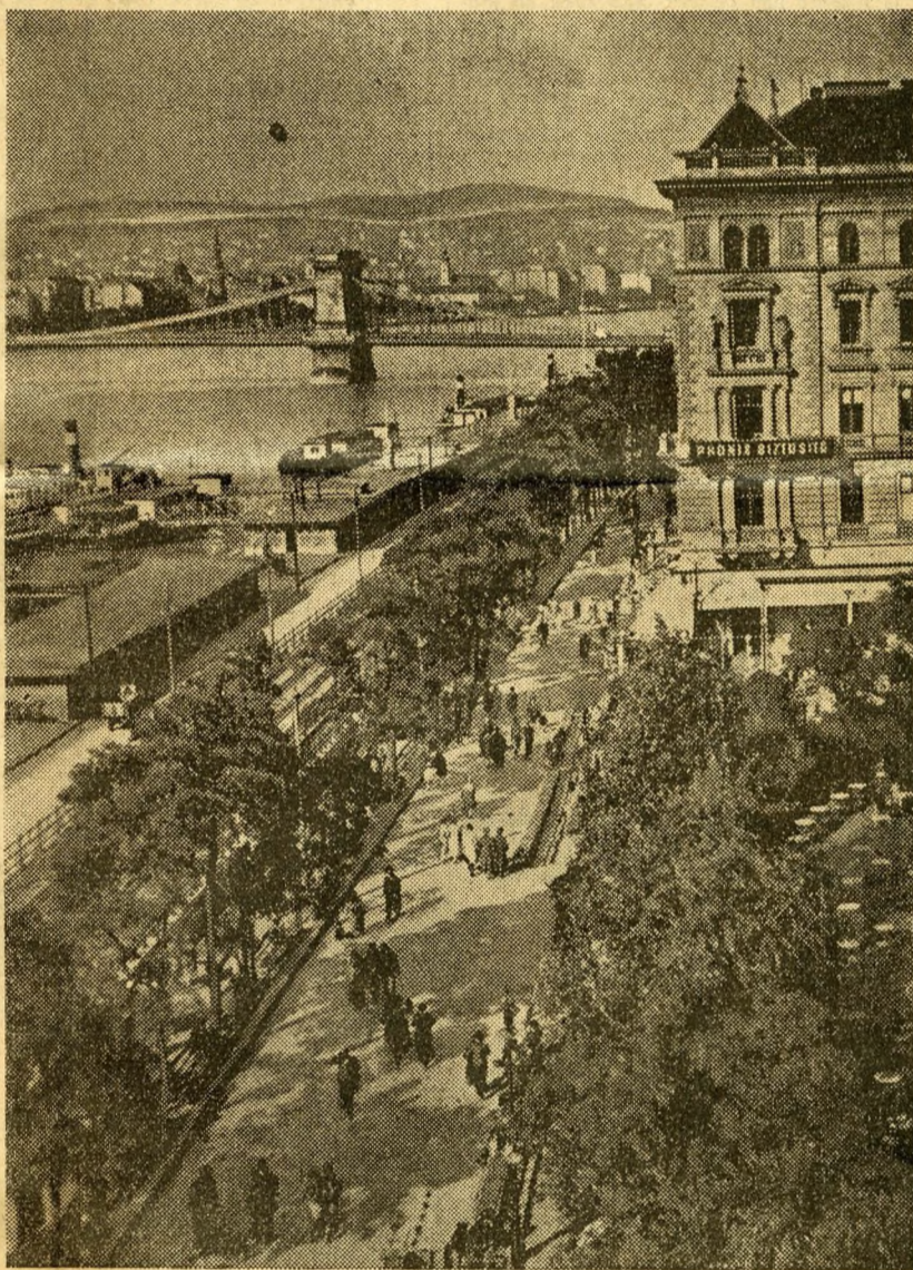
Le « Corso », au bord du Danube, où se retrouvent les élégantes et les flâneurs chaque après-midi et chaque soir.

— Allons, conclut-il, soyez raisonnable. Rentrez chez vous... ouvrez le gaz. Est-il besoin d'ajouter que l'anecdote est rigoureusement fautive ? Mais en voici une authentique qui en dit long sur la charmante naïveté de la police de Budapest.