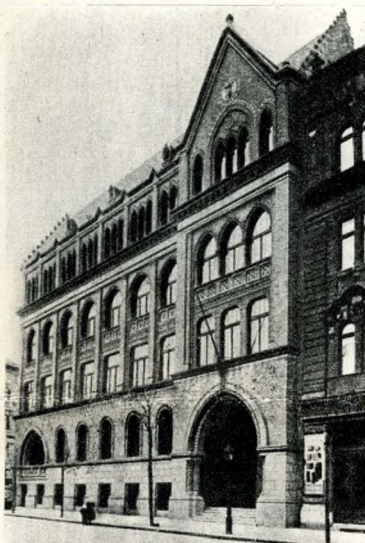
A Rákóczi téri iskolaépület 1911-ben...

„Szóbeli előadások és sajtó útján elosztani azon előítéleteket s elhárítani azon akadályo-