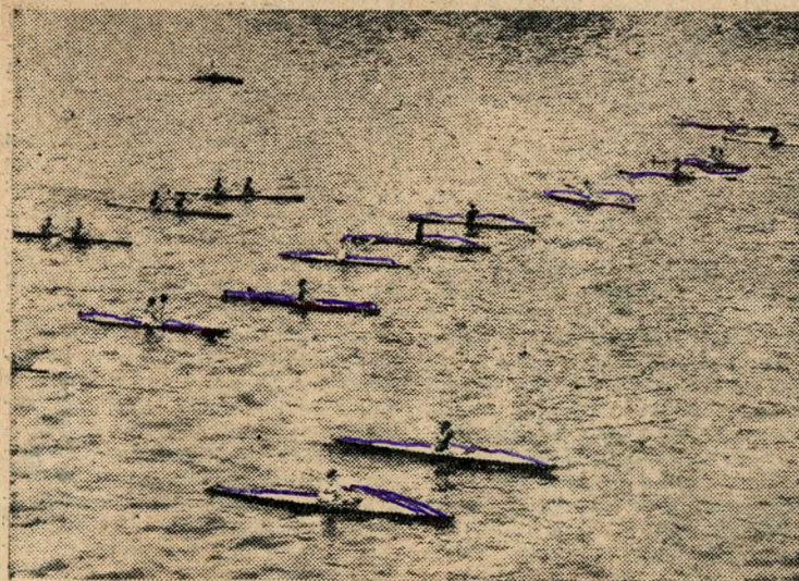
A kajakozók látványos felvonulása.

Senki sem bánta meg a Duna partján töltött néhány órát. A tikkasztóan forró szombat délután ritkán látható sportcsemegében volt részük a budapestieknek.