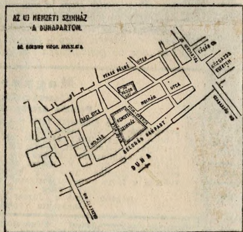
Az elhelyezési terv

Negyvenöt éve vendégeskedik a Nemzeti Színház a Népszínház épületében. Közel fél évszázada folyik a vita arról, hol épüljön fel az ország első drámai színházának végleges otthona.