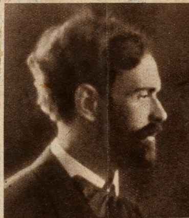
Az ötvenéves mester, 1932-ben. A »Hány János« diadalmasan bevonult az Opera színpadára, elkészült a »Maroszléki táncok« és felhangzott a »Székelyfő« nagyunk rá! Felmérni is alig tudjuk, mit jelent hazánknak, hogy a kor zeneművészetének

Itt él közöttünk, naponta láthatjuk fiatalos sudár alakját, magunkba szíhatjuk tanításait, hallhatjuk új műveit: büszkék