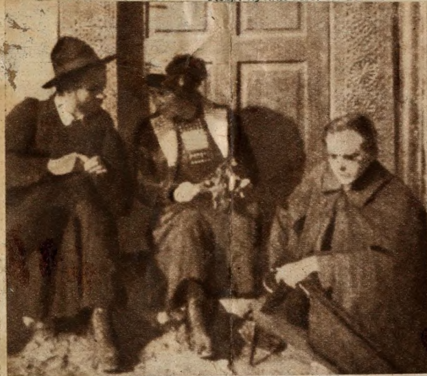
Népdalgyűjtemény körúton 1912-ben: Kodály Zoltán, felesége és Bartók Béla

D ecember 16-án, Kodály Zoltán 73. születésnapján, tanítványi szeretettel gondol rá az egész ország. Kodály Zoltán, aki nemcsak a zenének, hanem a tiszta és szabatos magyar nyelvnek is mestere, nem róhatja fel nekünk azt, hogy általánosságban fejezzük ki magunkat. Igen, az egész ország gondol rá szeretettel, mert nincs ma család Magyarországon, amelyhez Kodálynak és amelynek Kodályhoz köze ne volna. Nincs ma már család Magyarországon, amelynek életébe bele ne csöppent volna a zene tiszta méze, ha