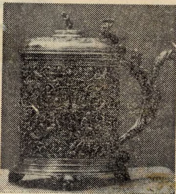
Fedeles kupa a XVI. századból.

Az érdekes kiállítás május 21-én nyílik.