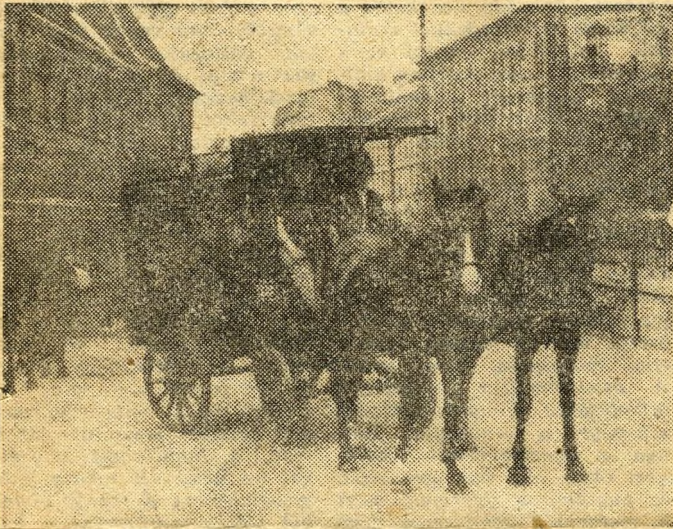
Eltűntek a városképből

Egyik képeslapunkban látjuk a fotografiát, amely Budapest felszabadulásának napjait idézi. A Verseny utcai postahivatalt mutatja, előtte néhány század eleji postakocsi, egy-egy búslakodó lóval.