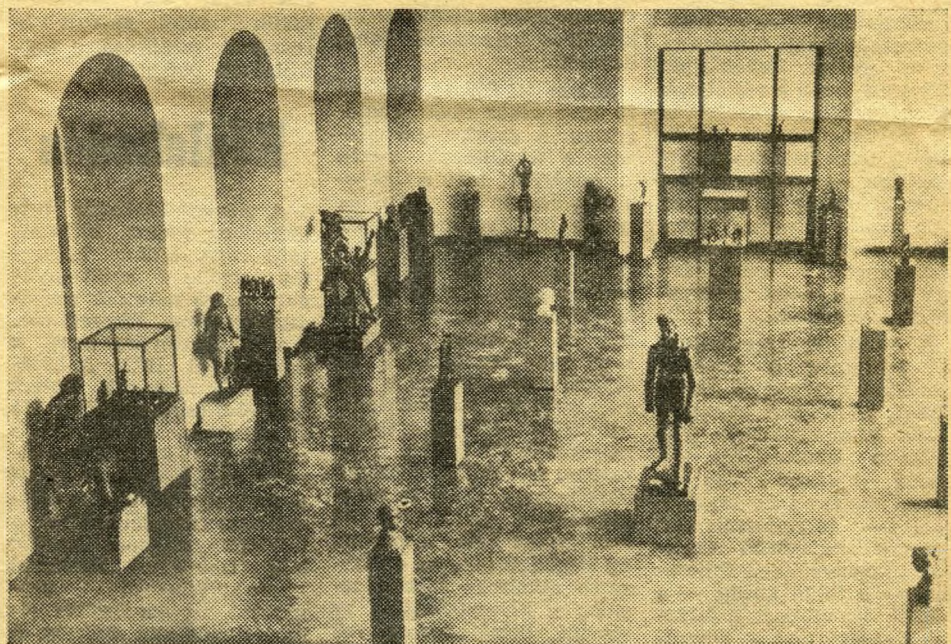
Új látnivaló: a várpalota egyik részébe költözött Nemzeti Galéria szobortára

Hétszáz éve királyok díszes rezidenciája, székhelye volt a Vár. Most ide gyűjtik össze évszázadok kincseit, művészeti alkotásait, az elődök hagyatékát. Feltámadtak a paloták, a lovagok, a madonnák szobrai... Milyen lesz az újjávarázsolt, romjaiból éledő Vár?