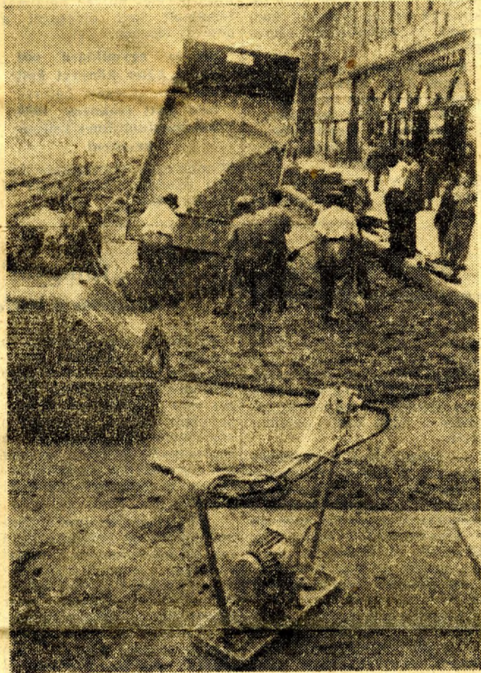
Billenő teherautón érkezik a beton a Rákóczi útra.

Ugyanezt a választ kapjuk a Körúton dolgozó valamennyi munkástól. Az építkezés legfőbb irányítói azonban nem ígérnek semmit. Azt magya-