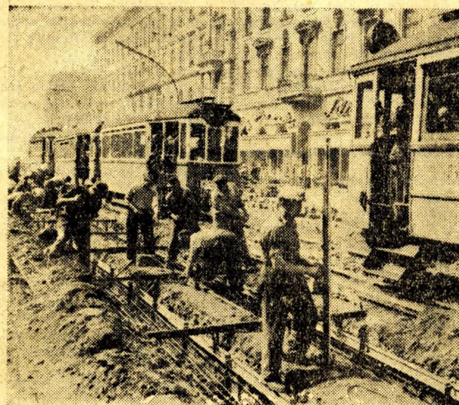
Vágányépítés a Bástya-mozi előtt.