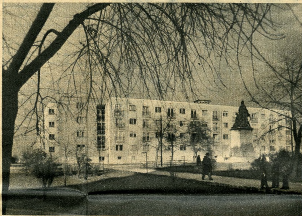
A Tanácsház téri új lakóházak