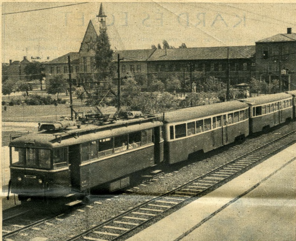
A csepeli gyorsvasút, háttérben az új Tanácsháza