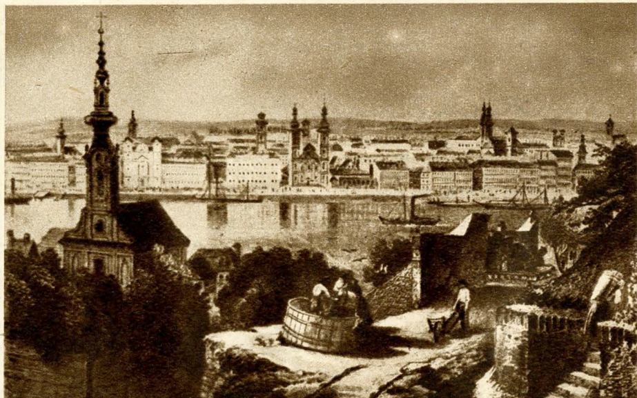
A pesti Dunapart látképe a múlt században (egykorú metszet). Az előtérben balra az 1945-ben elpusztult „Rác-templom”

szentélyrésze most is megvan. A sokat szenvedett épület barokk, majd klasszicista részekkel egészült ki.