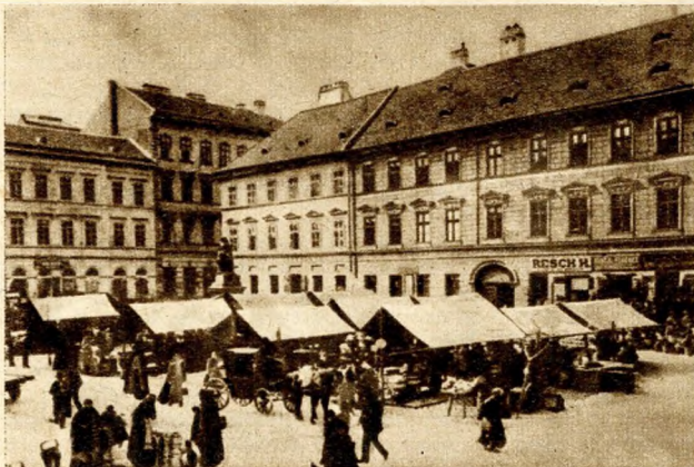
A Hal tér a múlt század hatvanas éveiben

Mindkét javaslat hibáinak oka a Belvárosi templom volt. A legmegfelelőbb hídtengely ugyanis éppen a templomon keresztül vezetett volna. Készültek is olyan tervek, amelyek a templom lebontását, áthelyezését vagy új templommal való pótlását javasolták. Olyan tervet is bemutattak, amely szerint a hídtengely a templomon át vezet ugyan, de a hídfeljáró két ágra osztva megkerülte volna a templom épületét.