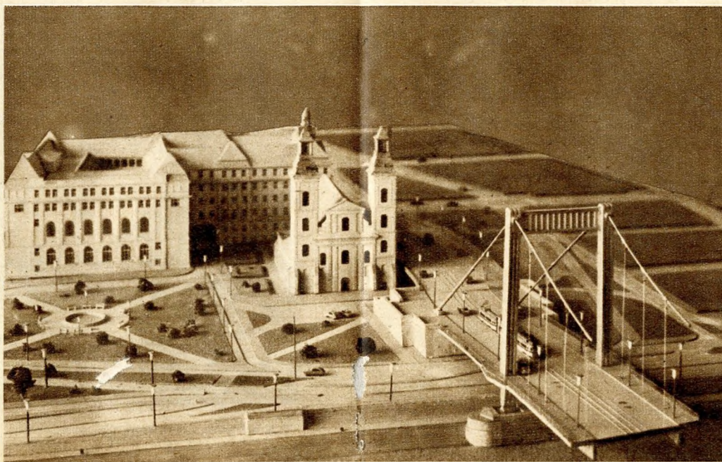
Az új Erzsébet-híd pesti hídfőjének modellje

Végül is úgy határoztak, hogy a templomot egyelőre megtartják, a hídfeljárót pedig közvetlenül mellette (a mai helyén) építik meg, s majd később a templom lebontása után alakítják ki a hídfőt megfelelő módon.