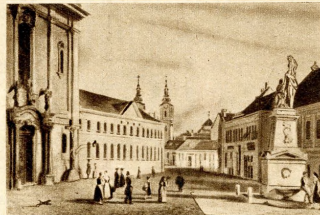
A Ferenciek tere 1835-ben. Előtérben a Nerelda-kút, amely ma a Népiútnak díszíti

Később, a forgalom várható növekedéséről is megkezdtek gondolkodni. Az ezt megelőző vizsgálatokat az egész Belváros területére ki kellett terjeszteni. Az új Erzsébet-híd megnyitásával ugyanis a kiskörűtől határolt városrész, sőt az azon túl fekvő területek forgalma is gyökeresen megváltozik. Arra is gondolni kell, hogy Budapest területén több híd már nem építhető, csupán az Árpád-híd-kiszélesítésére kerülhet sor.