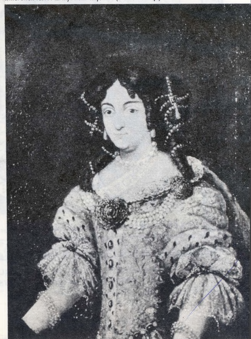
Ismeretlen festő: Zrínyi Ilona képmása (XVIII. sz. eleje)