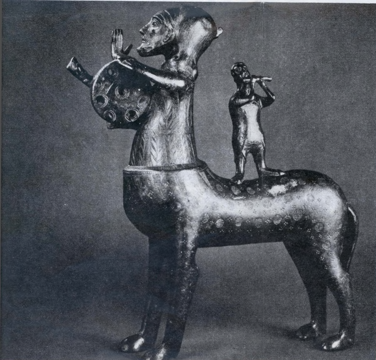
Kentauros aquamanile (XII. sz.)