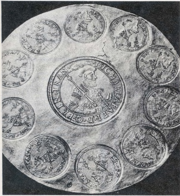
Apafi Mihály százdukátosa (1674)