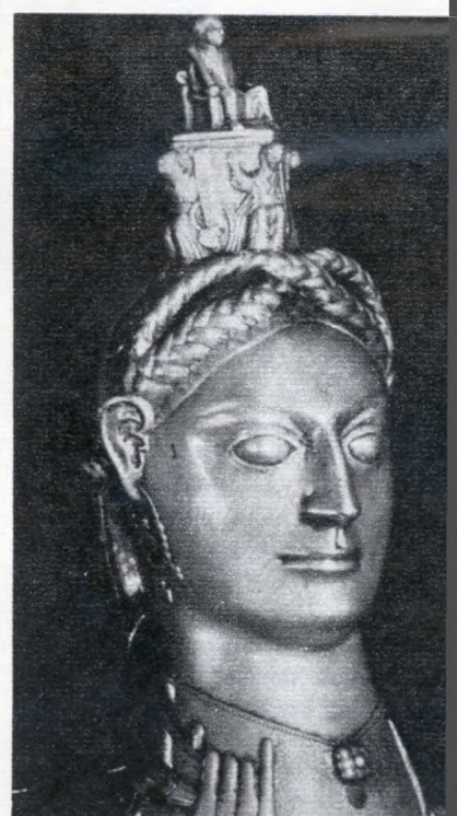
Női fej alakú aquamanile (XII. sz.)