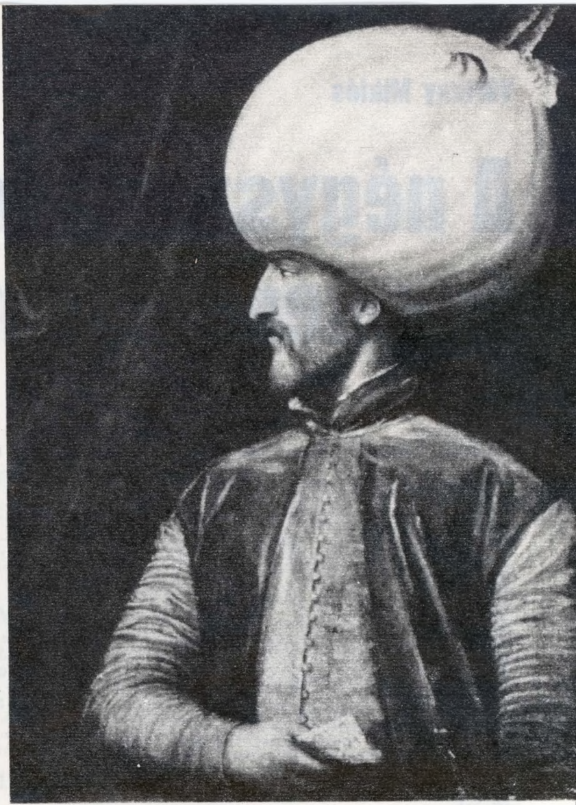
Tiziano követője: II. Szolimán képmása (1500 k.)