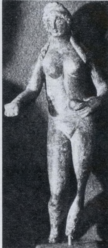
Vénusz bronzszobrocska (II. sz.)