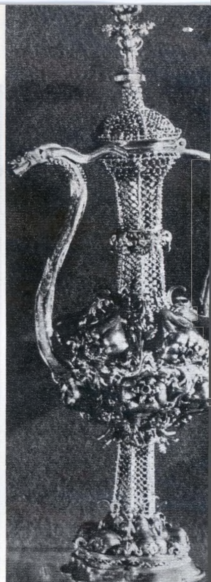
Nagyváradai misekanna (XV. sz.)