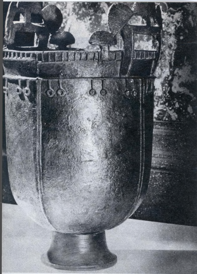
Hun áldozati üst (V. sz. eleje)