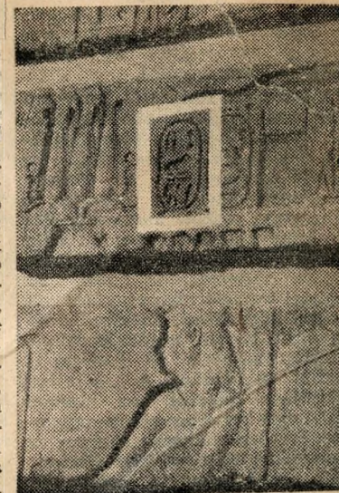
Közép-egyiptomi templomból származó faltöredék (fehér keretben I. Ptolemaios névjele).

Egy kis terem s mennyi, de mennyi érdekesség felsorolni is sok: fogadalmi szobrok, Sesonk trónörökös szobra, festett faszobrocskák, fajanszszobrocskák, állatmúmiák, amulett-gyűjtemény, napi használati tárgyak. E darabok mindegyike is külön-külön tanulmány tárgya, mi azonban csak egyet ragadunk ki a sok