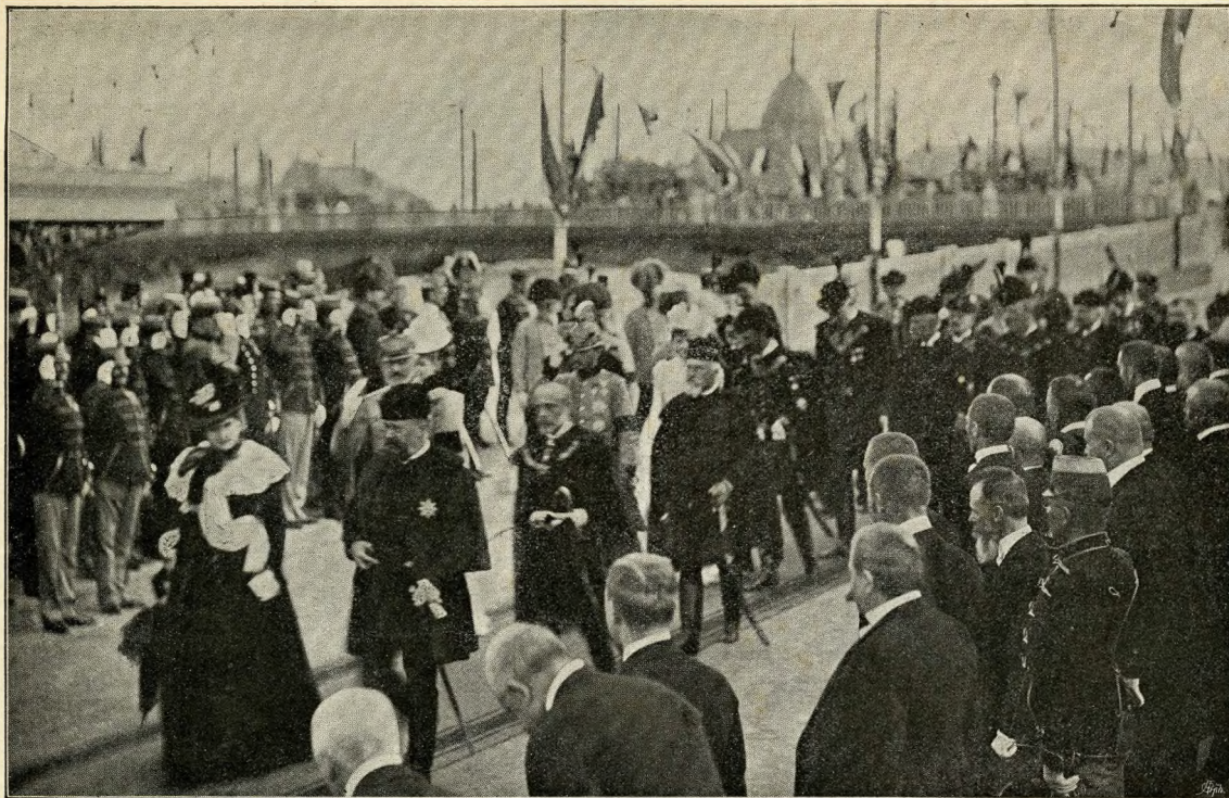
A FŐHERCEGI CSALÁD A MINISZTEREKTŐL KISÉRVE AZ ÜNNEPÉLYRE MEGY.

Számos közmondás is van a vöröshajú emberekről, a melyek egyáltalában nem hizelgők. Az ír nép szerencsétlenség előjelének tartja, ha az utazás kezdetén vörös emberrel találkozik. A régi Németországban egyes kisebb bűntényeket azzal büntettek, hogy a bűnöst kiültették egy árok közepébe, nagy vörös sapkával a fején és talán innen ered a bohócok piros csörgő-sipkája is.