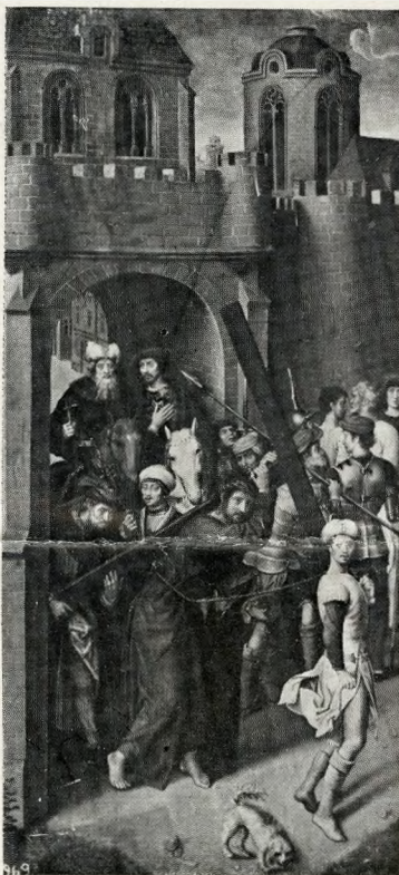
CALVAIRE DE HANS MEMLING, RECONSTITUÉ AU MUSÉE DE BUDAPEST AVEC LES DEUX VOILETS QUI SE TROUVAIENT À VIENNE.