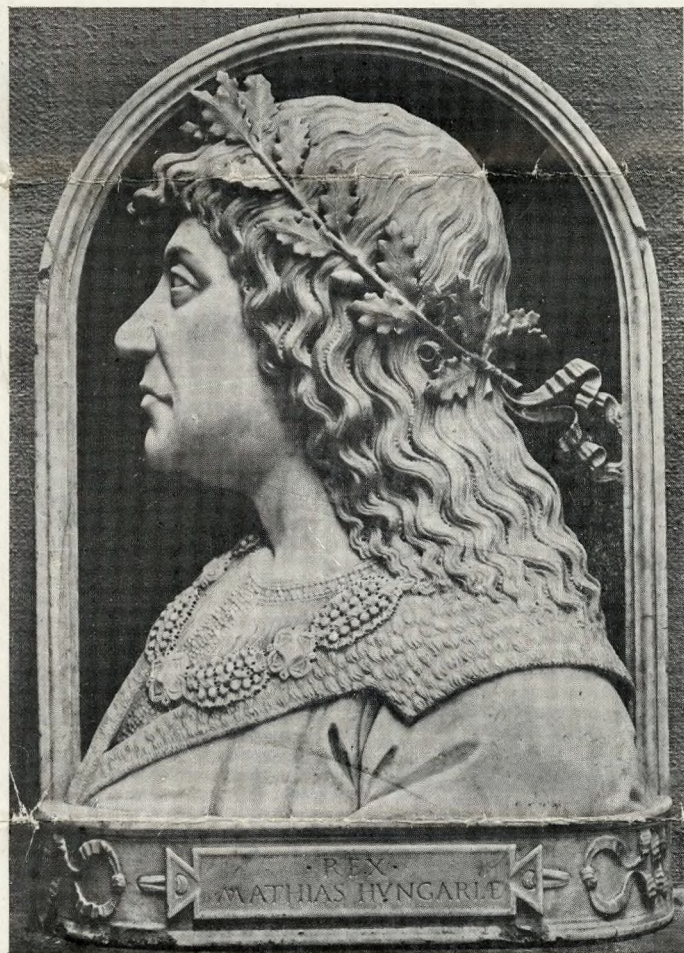
BÉATRICE D'ARAGON, REINE DE HONGRIE. ET MATHIAS CORVIN, ROI DE HONGRIE, BAS-RELIEFS D'UN MAÎTRE LOMBARDE, EXÉCUTÉS VERS 1485.

LE traité de Trianon, en rendant à la Hongrie, dont le passé fut si glorieux, une autonomie qu'elle avait perdue depuis longtemps, a provoqué une nouvelle répartition entre les musées d'Autriche et de Hongrie. La difficulté résidait dans le fait que la Hongrie d'aujourd'hui n'est pas territorialement aussi grande que celle de jadis. Un accord vient d'intervenir : les objets appartenant aux musées autrichiens et provenant de régions qui furent hongroises, mais ne le sont plus, restent en Autriche, tout en devenant co-propriété des deux États, tandis que les œuvres originaires des provinces qui forment la Hongrie actuelle ont quitté Vienne pour Budapest.