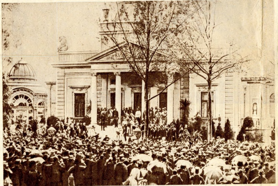
Megnyitási ünnepély. Alsó kép: a záróünnepély. (Egykoru fényképek.)

Az a kor nem ismerte a buza-dumpinget. Tejfel-mézszel folyt az ország s a buzát, tejet, mézet el is lehetett adni. Jó volt földbirtokosnak lenni, jó volt falusi kastélyban