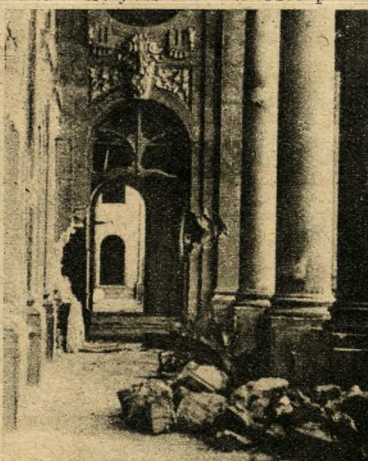
A Vár Dunára néző erkélyfolyosóját is megtisztítják a romoktól.