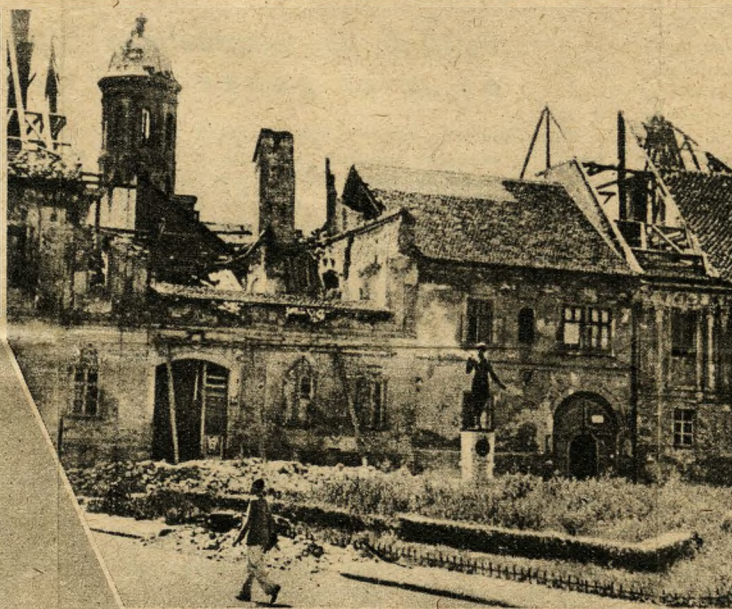
Az utca ismét szabad: a Hatvány-palota újra lakható.

őrizni és ahol csak lehetséges, rekonstruálni az elmúlt századok történelmi stílusát és hangulatát.