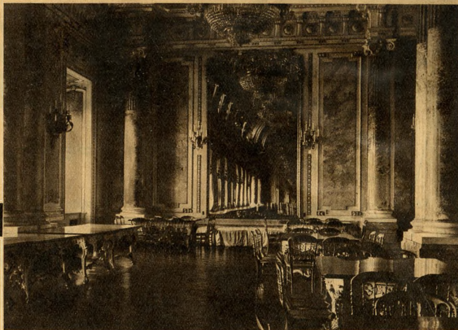
A királyi palota kis ebédlőterme.

A forradalom alatt a királyi palotát is detronizálták. Ebből az időből származó útikalauzokban úgy van feltüntetve: «Nemzeti Palota (azelőtt királyi vár).» Uj neve azonban nem talált bele a nemzet hangulatába és lassan kitöröljünk emlékezetünkéből ennek a rövid korszaknak minden újítását. A palota telején ragyogó Szent Korona alatt fekvő hatalmas termek megannyi történeti jelenet néma tanui és hangtalan méltósággal őrzik nagy idők dicsőséges emlékeit.