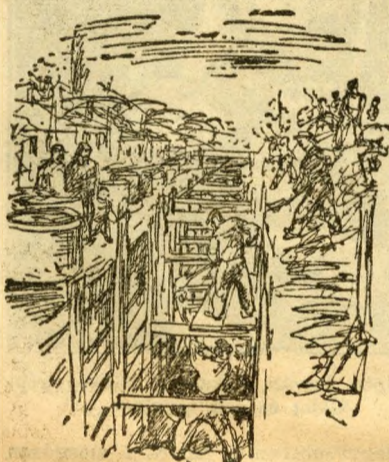
Új városi házak épülnek

A városháza nem akarta a WM-et, de a WM „megszerezte magának” a