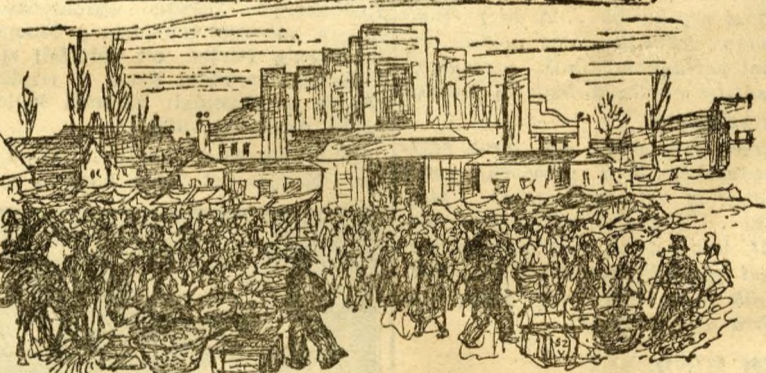
A piacér hajnalban

volt ennek a mai 80.000-es városnak, kelető, nem hét, nem húsz. Egyik közülük a földreomlott városháza. Azt öntvénykenylen újjáépítették az erzsébetiek. A felszabadulás után három használható tanterem állót a pedagógusok rendelkezésére: ma 118. Óvodát hetet hoztak helyre, építettek a leventelőtér romjaiból egy 80 ágyas napközi gyermekkórházat, rendbehoztak és felszerelték egy 60 ágyas szülőotthon, egy rombadólt tüdőgondozót változtattak át modern orvosi csodává. Száraz dolog az ilyen leírás. De milyen „életszagú” ügy, amikor egy város újjáépül és szervezkedik! „Most megszerveztük a házilagos munkát, fele árért!” „Most központi műhelytelepet létesítünk, ahol minden ipari munkát saját városi iparosaink végeznek!” „Most pénzt teremtünk elő, akárhonnán!” „Most teljesítjük végre, amit egykor a prolinak ígértek, az utat, a járdát, a vízvezetékét... és hozzáépítünk mindent, ami az emberi élethez szükséges...!”