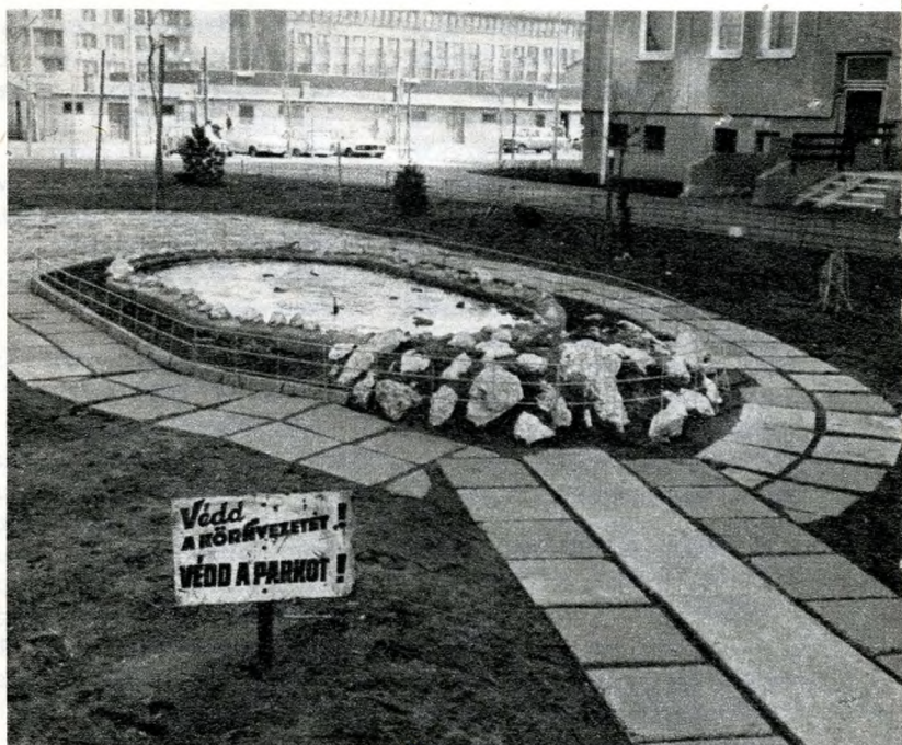
Társadalmi munkában készült a tavacska

A csepeliek mindig híresek voltak a társadalmi munkáról. A kerület lakói és az üzemek dolgozói évente két kommunista szombaton közel 17 millió forint értékű társadalmi munkát végeztek az elmúlt öt évben. 38 ezer négyzetméter járdát építettek, négy játszóteret létesítettek, rengeteget dolgoztak a Barát-ságpark létrehozásán, három kis méretű sportpályát csináltak, és ötezer fát ültettek a kerület több utcájában. Tavaly, a hatodik öt éves terv első évé-