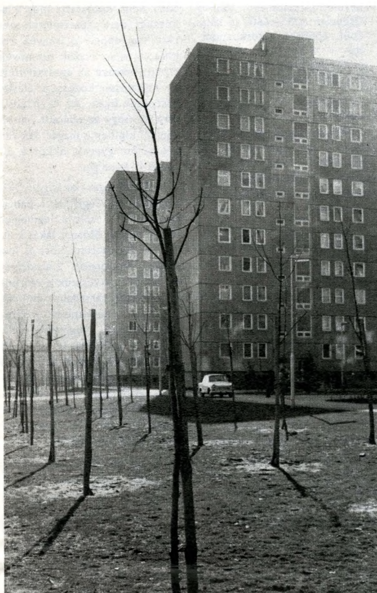
Több mint 18 ezer facsemétét és cserjét ültettek el

Hiába keresné a régi, falusi képet mutató települést, aki tíz évvel ezelőtt járt Csepelen. Az V. ötéves terv időszakában összesen 5195 lakás épült. A Csepel Művek 2318 lakást építtetett, a Magyar Posztógyár pedig összesen 2200 lakással járult hozzá a XXI. kerület arculatának formálásához. Az elmúlt tervidőszakban öt és fél, a jelenlegiben pedig hatmilliárd forintot költenek, illetve költöttek