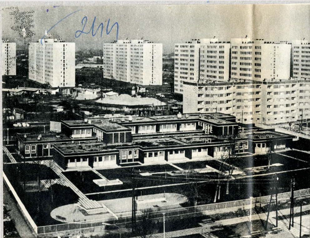
Füredi úti lakótelep