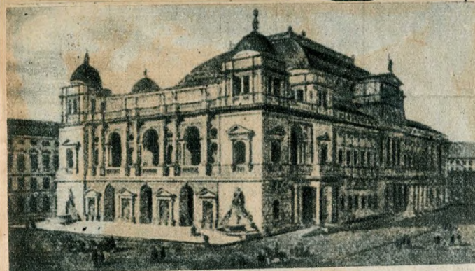
Ybl Miklós pályaterve