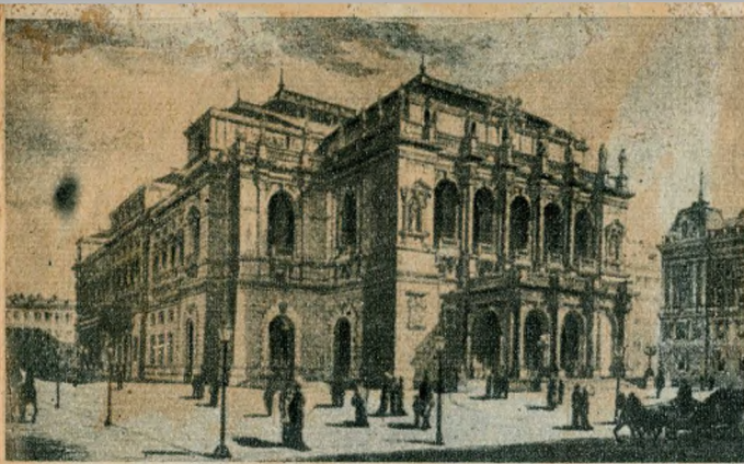
Az Operaház első tervrajza