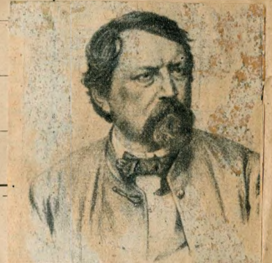
Ybl Miklós, az Operaház épületének alkotója (1814–1891)

Az építkezés megkezdését azonban pénzügyi válságok és a kolerajárvány késleltette. 1875 őszén megkezdődtek a földmunkák, de a korabeli sajtócikkek gúnyolódó hangon felesleges fényűzésnek tartják. »Ha már emelkedik a ház, melynek alapja le van rakva, sőt alsó falai is, hadd épüljön! Igen gyakorlati használatra fog szolgálni akár karszárnyának, kár kórháznak, de leginkább olyatén ápolóintézetnek, melyben még nemrég jómódú, de ma már véginségre jutott tisztas állampolgárok ellátást találnak.« Így ír a Kelet Népe »Skeptikus« aláírású, Bécsből kelt cikkében.