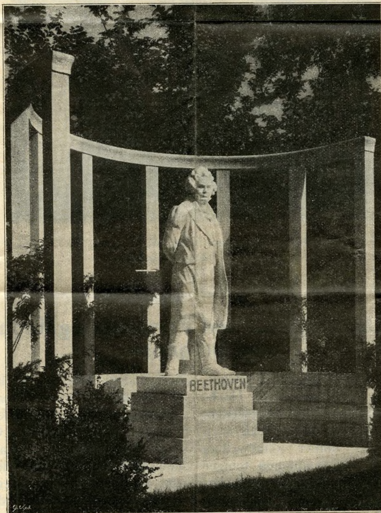
Beethoven-Denkmal im Heiligenstädter Park, Wien XIX. (Seite 99.)

Vor allem wollen wir das Projekt von 90 Schulbauten erwähnen, welche die zu Schulzwecken benutzten Miethäuser dem Wohnzwecke wieder zu-