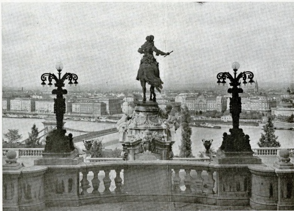
Budapest: palazzo Reale - monumento al Duca Eugenio di Savoia

Carlo V. Dall'altra parte, in Oriente, moriva nel 1520 Solimano I, che, dopo le vittorie dei suoi primi anni, aveva tenuto un pacifico governo, e gli succedeva Solimano II, che fu poi detto il Grande, il quale anelava ad illustrarsi con segnalate vittorie. Egli si volse subito all'indebolito regno d'Ungheria, tenuto da un giovinetto, e gli impose di scegliere tra un vergognoso tributo e la guerra. E la guerra scoppiò terribile, e l'Ungheria toccò una prima disfatta, nel 1521, davanti a Belgrado.