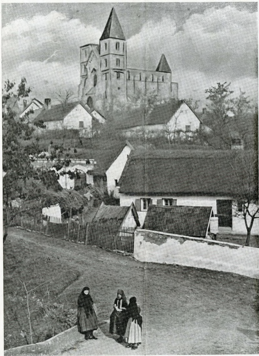
Vecchia Ungheria pittoresca