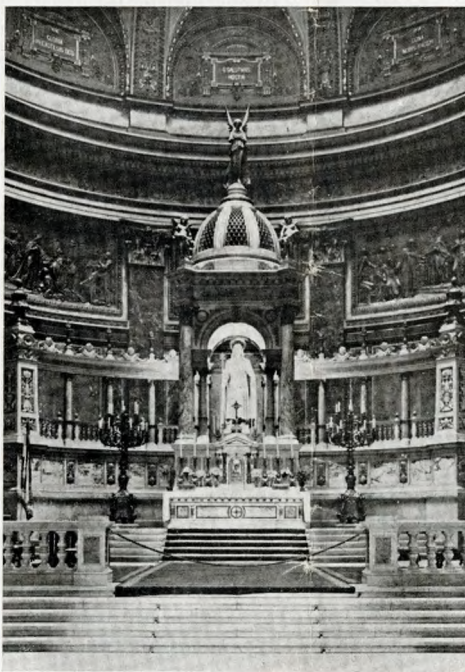
Budapest: basilica di S. Stefano, Re d'Ungheria (tardo Rinascimento)

Quella civiltà, che il genio organizzatore di Roma riuscì a