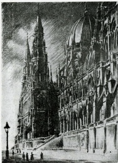
Budapest : palazzo del Parlamento

per ricevere completo quel tesoro, che è l'ornamento più alto della vita civile e il segno del compiuto progresso. La biblioteca, che già aveva il nome di Corvina , e che, prima ancora di essere compiuta, sollecitava l'alto elogio di Angelo Poliziano, che la diceva ricchissima tra le più ricche, ostentava le splendide rilegature, i colori degli ornamenti miniati e la ricchezza e la varietà del contenuto. Il re vi aveva raccolto, da Bisanzio, da Venezia, da Ferrara, da Firenze e da Napoli, le opere più preziose degli antichi scrittori latini e greci, e le aveva voluto decorate dagli ornamenti più ingegnosi e attraenti. Egli aveva mandato a Firenze Taddeo Ugoletto, precettore del suo figliolo, perchè fossero ricopiati i codici medicei raccolti nella Laurenziana; e Marsilio Ficino aveva mandato in Ungheria il proprio discepolo Filippo Valori, per appagare il desiderio del re di conoscere la filosofia platonica. Nella reggia di Buda, trenta copisti lavoravano incessantemente a copiar codici antichi, e le cronache dicono che la biblioteca