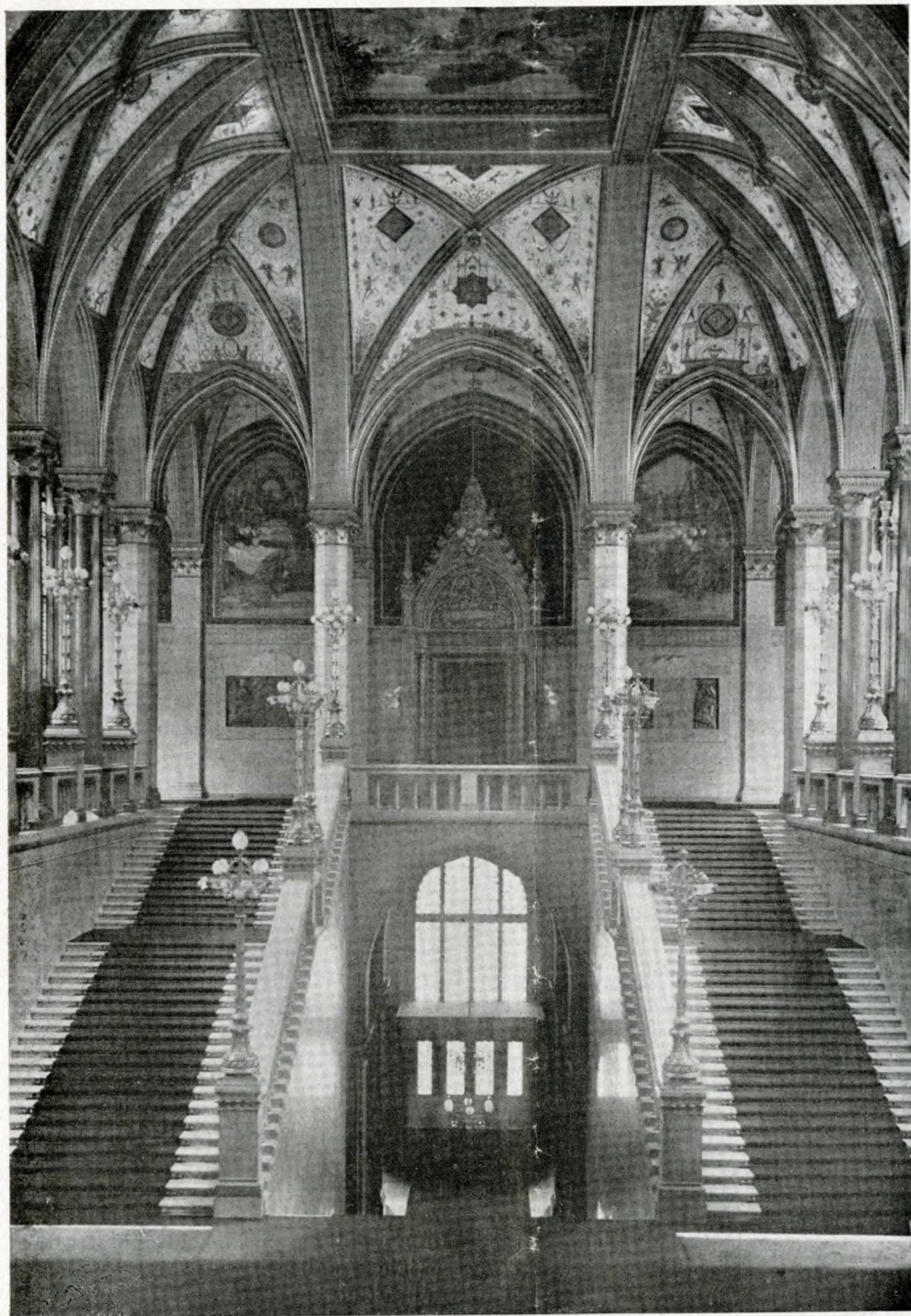
Budapest: palazzo del Parlamento. Scalone d'onore