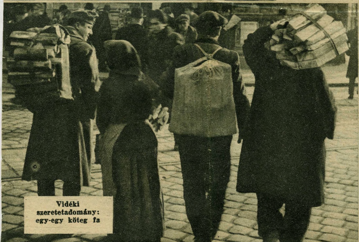
Vidéki szeretetadomány: egy-egy köteg fa