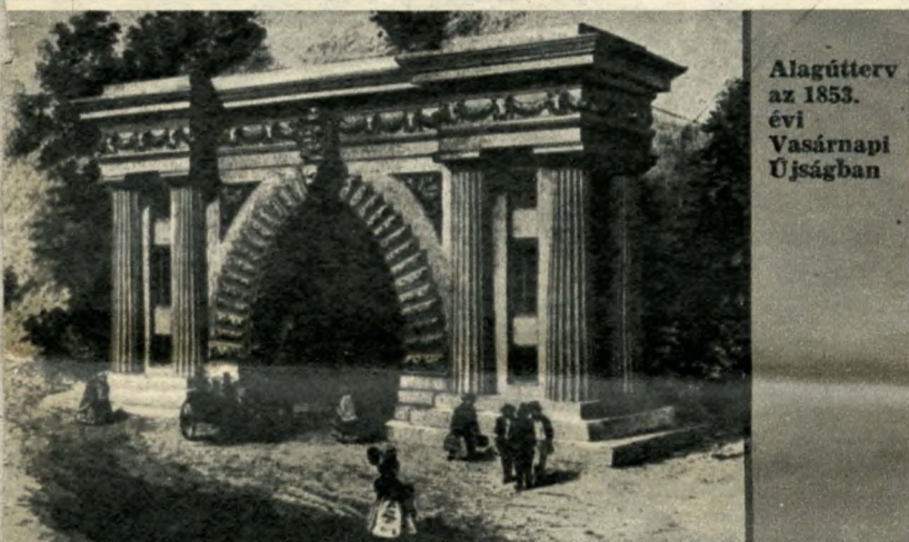
Alagútterv az 1853. évi Vasárnapi Újságban