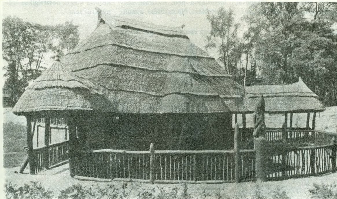
A régi Krokodilház