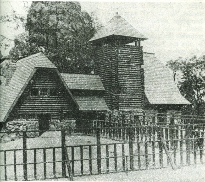
A 2. világháború alatt lebombázott Bölényház