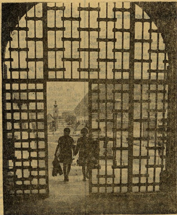
Modern vasrács az antik kapun. Itt léphet be a múzeum-látogató a középkorba is.

Látogatás a középkori várpalota falai között