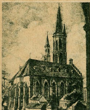
XVII. század végén és a XVIII. század elején.

1723 március 28. nagyszombat. írja a krónikás. A Nagyboldogasszony-templom harangjai zúgnak, a feltámadási körmenet a Bécsi-kapu felé jár. Az utcákon hullámozik a tömeg, a házak feldíszítve, az ablakokban égő gyertyák. Az ünneplő nép díszbe öltözve, a lányok hajadonfővel, a menyecskék fejkötővel és fátyollal. Az aranypettyes, csipkézett, ékkövekkel, gyöngyökkel, aranyaszomántos, magyar hímzéssel díszített női ruhák szebbnél szebb színeket játszanak a hegyek mögött lassan eltűnő bágyadt tavaszi nap sugariban.