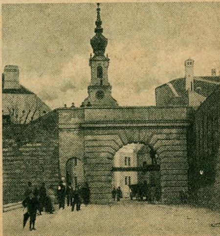
A Bécsi-kapu. Lebontották 1891-ben.

gódva lesik, figyelik a fejleményeket. A tűz rohan tovább, a szél is segítségére jön. Az ezer és ezer égő szikrát, amint felszáll, viszi, átdobja a következő házra. A Nagyboldogasszony-templommal szemben lévő városháza tornyának tűzjelzője szakadatlanul működik, a harangok Isten segítségét kérik, az éjjeli örök felverik a vár alsó lakosságát, hogy a felső rész segítségére jöjjön. A Dunából tömlőkben, hordókban hordják a vizet, de semmi, semmi sem segít, a tűz mint a villám repül a Nagyboldogasszony-templom felé. Belekap a templom fedelébe, átnyargal rajta és egy része a Fehérvári-kapu közelében lévő puskaporos torony felé tart. Rettenetes perceket él át Buda, ha a torony felrobban,