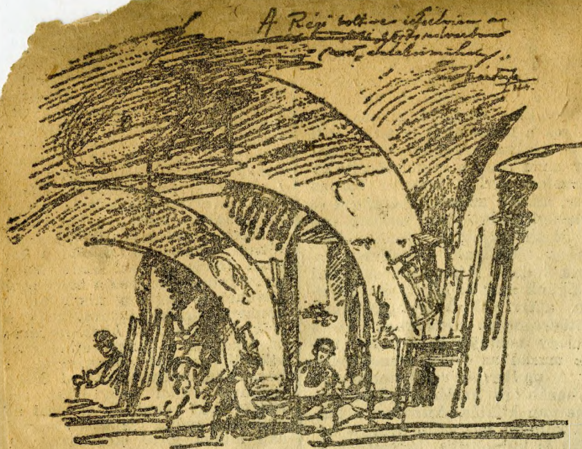
Asztalosműhely a görögudvarból, amely az 1770-es évek táján a piaristák refectoriuma volt