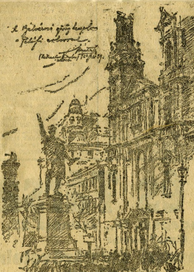
A belvárosi görögtemplom, a Dunaszélen, a Petöfi-szoborral

ellenben szabad, nyílt Petöfi-tér, a me-reven égnek nyúló Petöfi-szoborról, a régi Pestnek egyik sűrűn emlegetett tórsége volt. A különben sivár, diszta-len torocsokót főként a szobor és a szo-