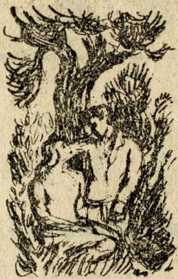
Margitszigeti fák alatt